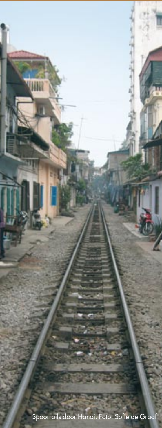
Spoorrails door Hanoi.

Cora van Nieuwenhuizen, gedeputeerde voor Mobiliteit, Infrastructuur en Handhaving: