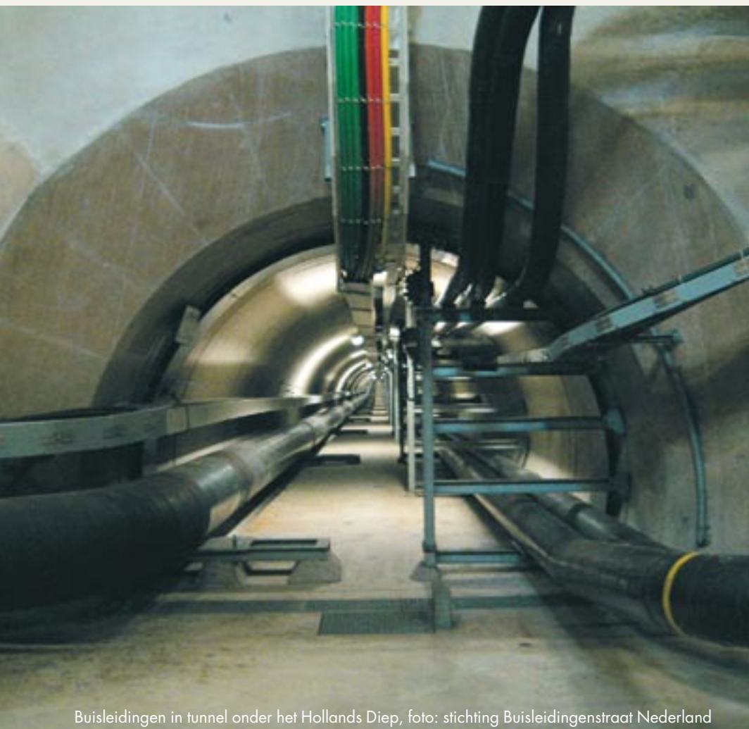
Buisleidingen in tunnel onder het Hollands Diep

In onze gemeente bevindt zich ook de 'snelweg' voor buisleidingtransport in Nederland, de buisleidingenstraat van Rotterdam naar Antwerpen. Deze wordt op dit moment maar voor 30% benut. Dat betekent dat we bij beslissingen in de omgeving van deze buisleidingenstraat ook rekening moeten houden met nieuwe buisleidingen, waarvan we de risico's nog niet kennen. Daarnaast zal de veranderende regelgeving gevolgen hebben voor de huidige risicobenadering. Die onzekerheid kan niet te lang duren. Daarom dringen we erop aan dat we snel helderheid krijgen over de nieuwe regels en inzichten in de risico's van buisleidingtransport.'