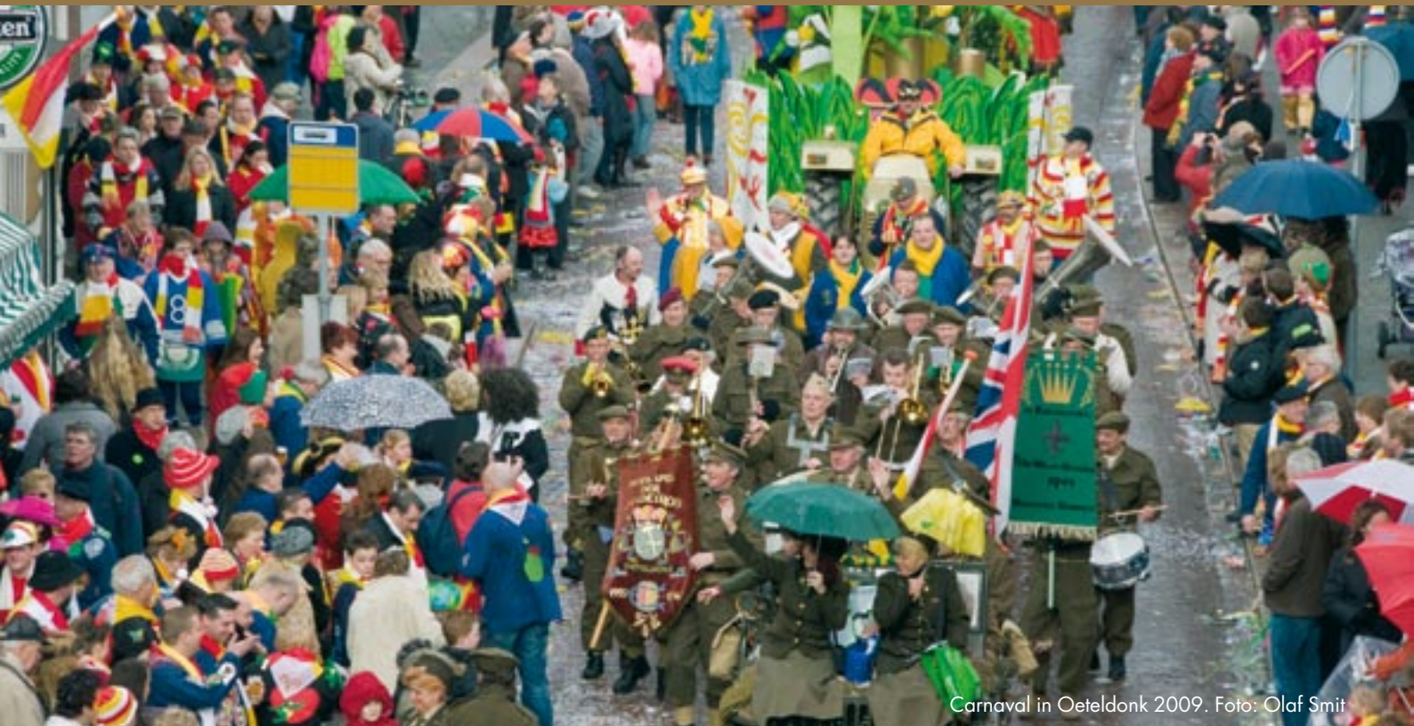
Carnaval in Oeteldonk 2009.

Carnavalsoptochten, dorpsfeesten, wandelvierdaagsen, kermissen. Brabanders lusten er wel pap van. De feesten buitelen soms letterlijk over elkaar. Politie, brandweer en hulpdiensten moeten vaak overal tegelijk zijn. Dankzij de activiteitenkalender kunnen zij hun inzet beter bepalen en op elkaar afstemmen.